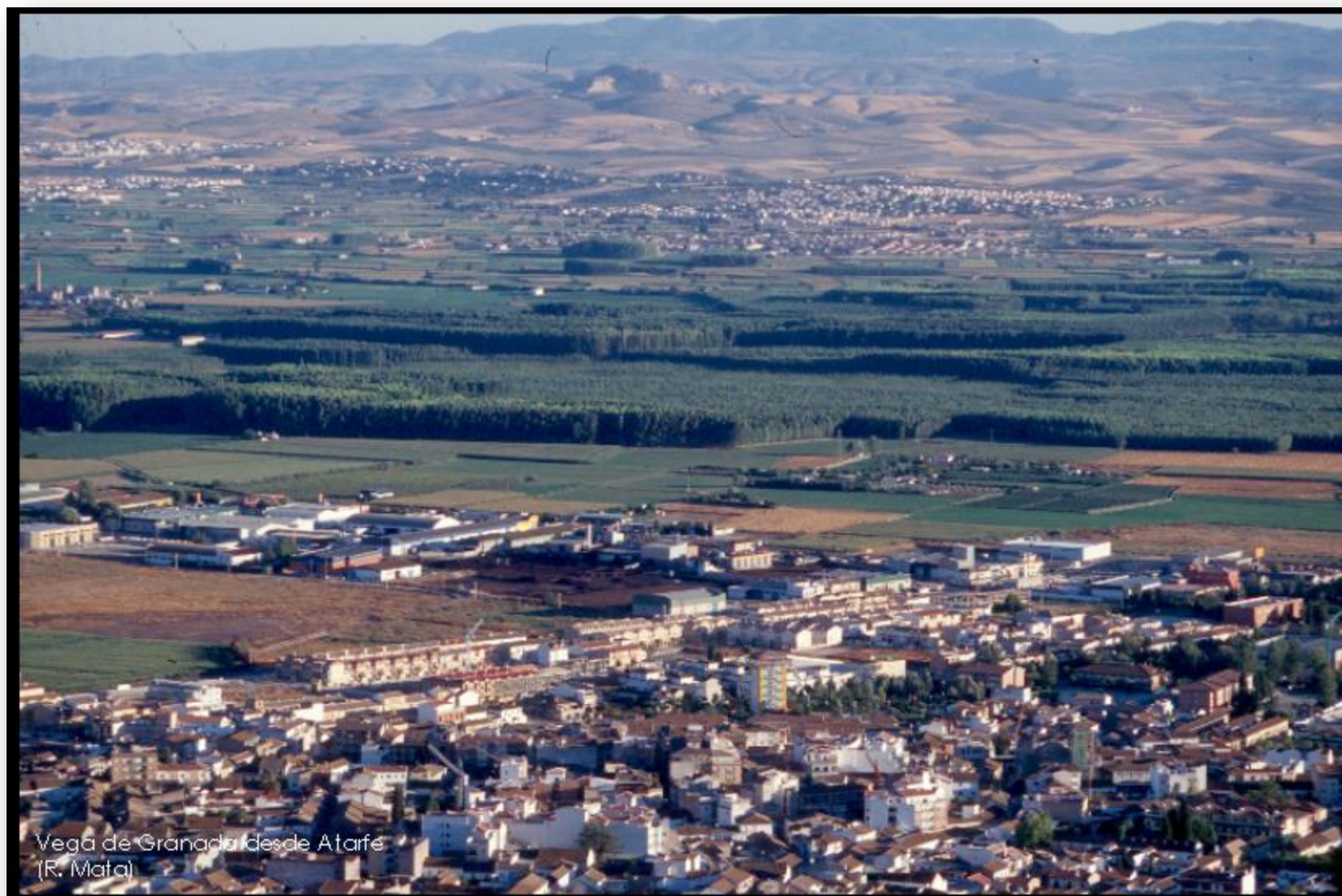
Vega de Granada desde Atarfe (R. Mata)